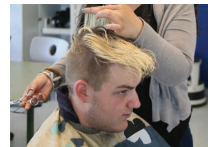
... bis zu der am Modell.